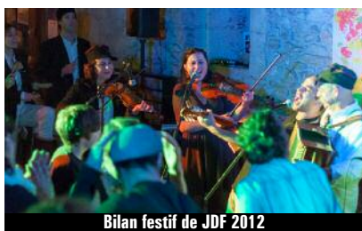
Bilan festif de JDF 2012