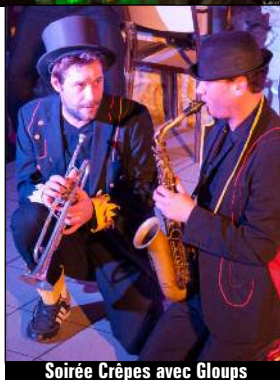
Soirée Crêpes avec GLOUPS