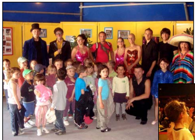
Les enfants de l'école maternelle de Feigneux

Merci aux artistes du cirque de leur accueil chaleureux, aux parents et Atsems qui nous ont accompagnés et aux mairies de Fresnoy la rivière, Russy Bémont, Feigneux qui ont permis cette sortie.