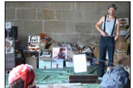
Gorki à "Jour de Fête"