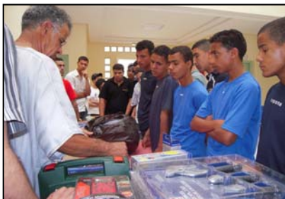
Centre des apprentis de Sefrou