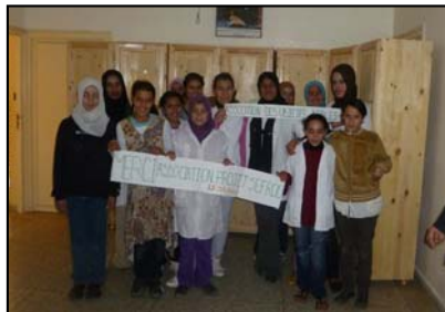
Pensionnat des filles Bhalil