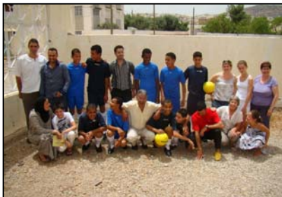
Orphelinat de Bhalil